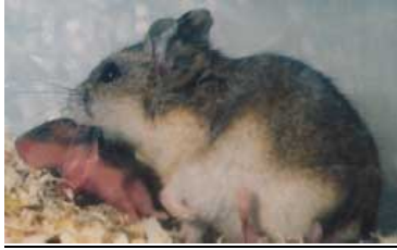
Ein Männchen des Dschungarischen Zwerghamsters mit einem Jungen