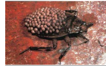
Männchen von südamerikanischen Riesenwanzen tragen die Eier auf ihrem Rücken und kümmern sich darum, dass sie geschützt sind, nicht austrocknen, und genügend Sauerstoff erhalten.

dort ersticken oder von Geschlechtsgenossinnen kannibalisiert würden. Deshalb kleben sie ihre Eier auf dem Rücken eines Männchens fest, der sie gelegentlich eintaucht, damit die Brut nicht austrocknet. Und je mehr Eier ein Männchen versorgt, desto wahrscheinlicher wird dieser Tugendbold auch von anderen Müttern zum Bewacher ihrer Eier auserkoren.